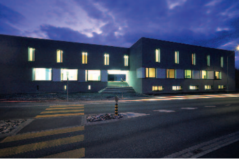
Liechtensteinische Musikschule, Triesen